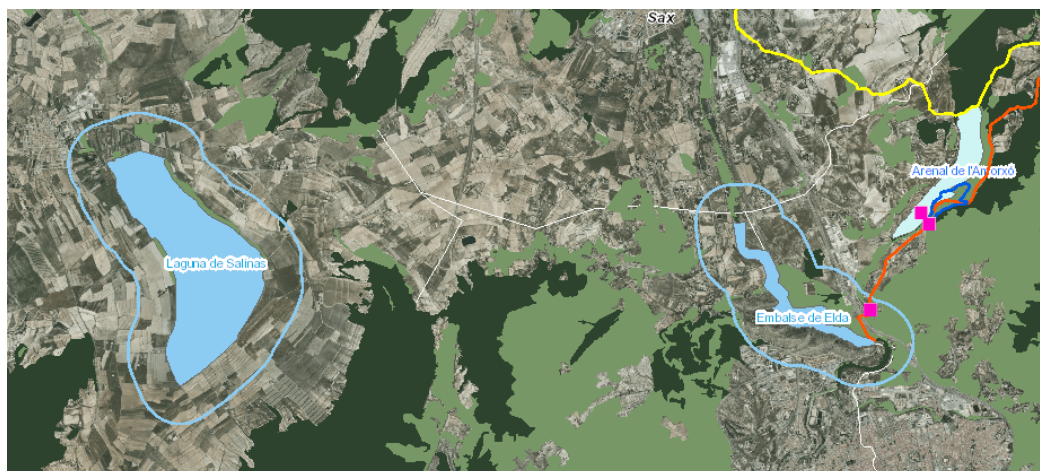
DETALLE DEL VISOR CARTOGRÁFICO GVA DONDE SE OBSERVAN LAS ZONAS HÚMEDAS CATALOGADAS DE SALINAS Y EMBALSE DE ELDA