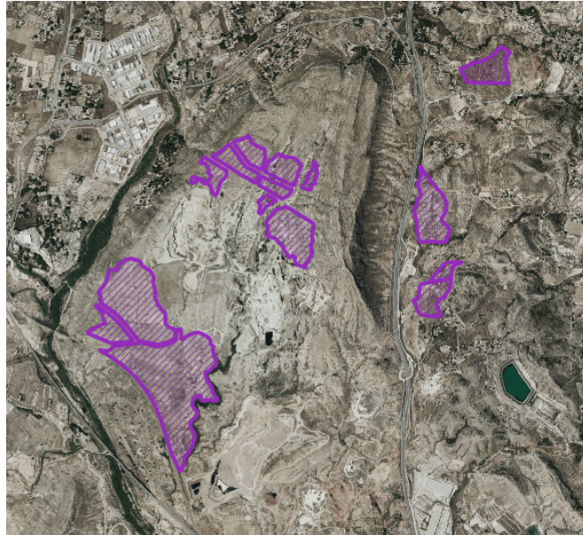
Plantas fotovoltaicas en tramitación según Visor Cartográfico de la Generalitat Valenciana

En el apartado 9. Análisis de Efectos Sinérgicos y Acumulativos se recoge que en un ámbito de estudio de 3 km de radio no hay proyectadas otras plantas fotovoltaicas, cuando esto no es así, de acuerdo a lo establecido en el Visor Cartográfico de la Generalitat Valenciana, estando algunas de ellas en fase de construcción: