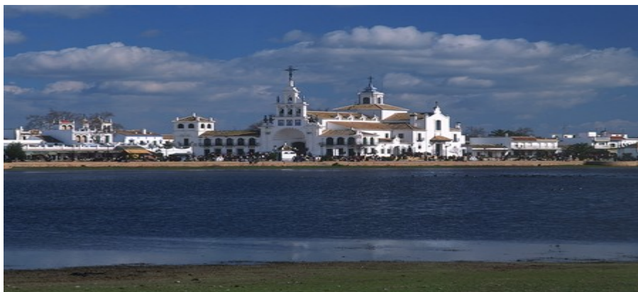
Aldea del Rocío