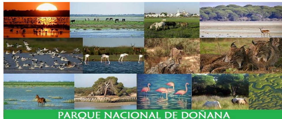
PARQUE NACIONAL DE DOÑANA

VIAJE AL PARQUE NACIONAL COTO DOÑANA, SEVILLA y CÓRDOBA. Del 1 al 3 de Noviembre. (PUENTE DE TODOS LOS SANTOS)