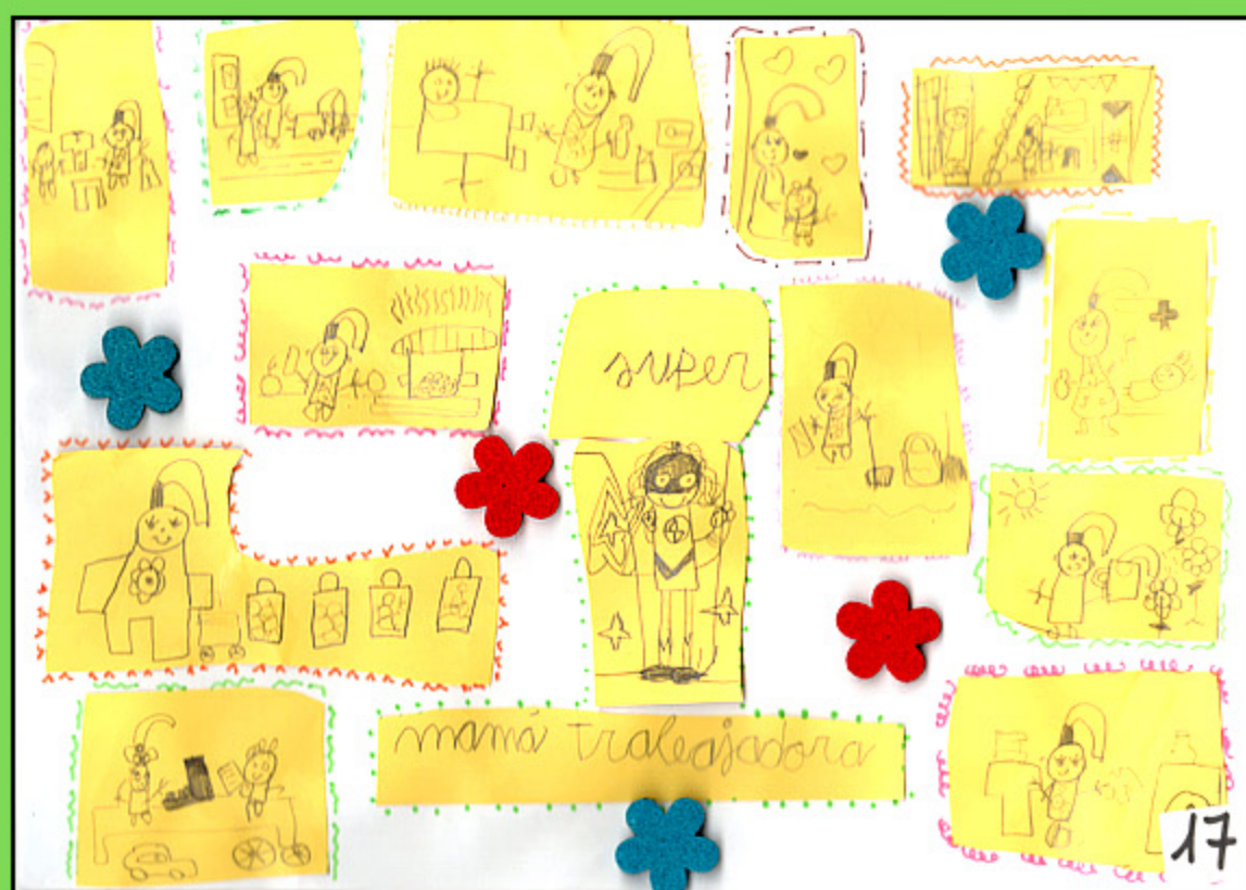
Premio Categoría Infantil XI Concurso

8 DE MARZO DÍA INTERNACIONAL DE LA MUJER 2019