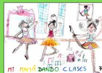
Premio Categoría 1ª Primaria XI Concurso