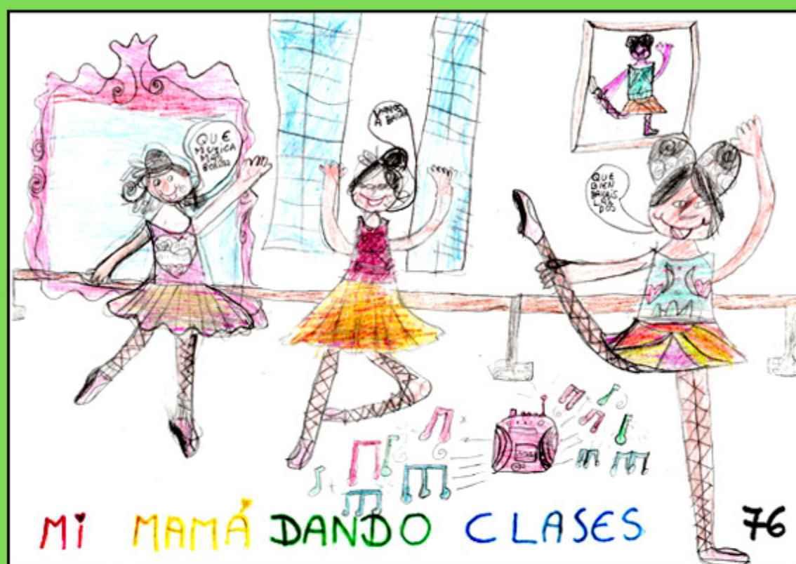
Premio Categoría 1ª Primaria XI Concurso