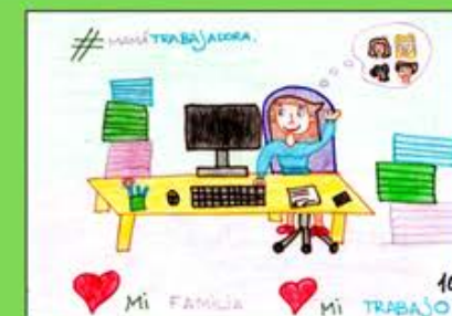
Premio Categoría 2ª Primaria XI Concurso