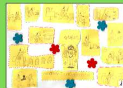
Premio Categoría Infantil XI Concurso